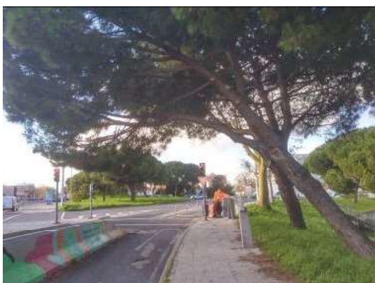
Av. Marechal Gomes da Costa – R. Cidade de Bissau (Plantação de novas árvores)