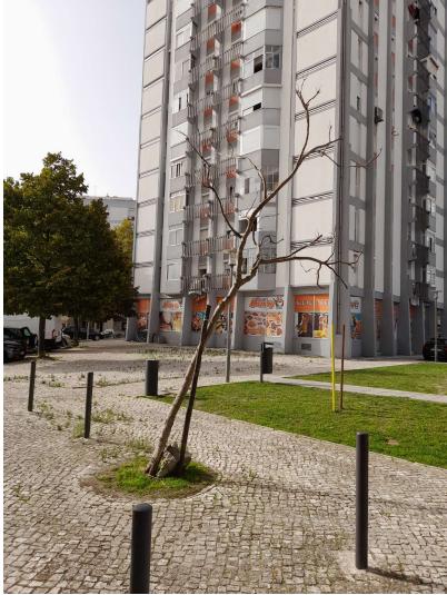
Localização da árvore com cod. SIG 2185: Olivais - Rua de Manhiça