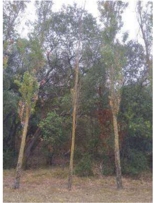
Fig. 5 - Aspeto geral do exemplar totalmente seco.