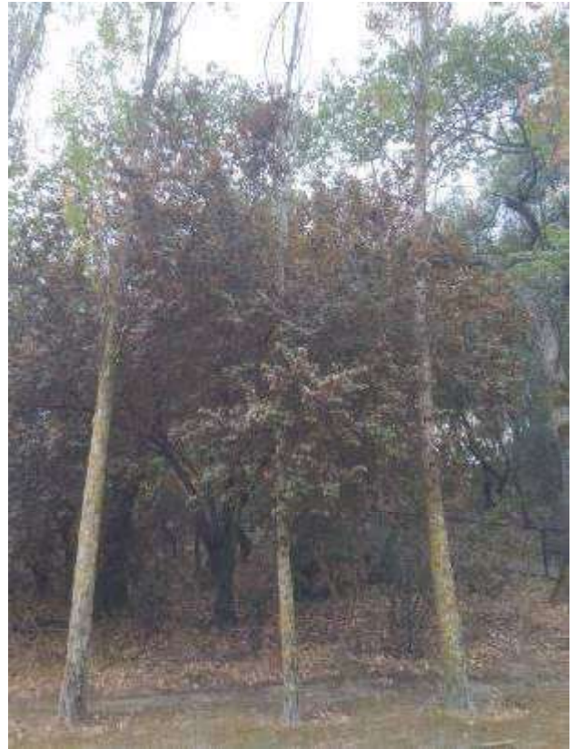
Fig. 4 - Aspeto geral do exemplar totalmente seco.