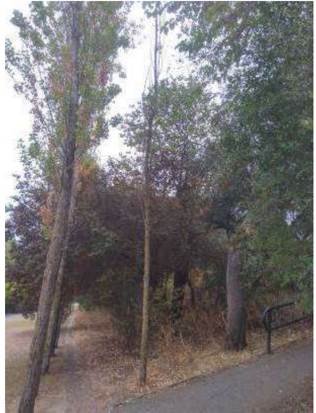
Fig. 3 - Aspeto geral do exemplar totalmente seco.