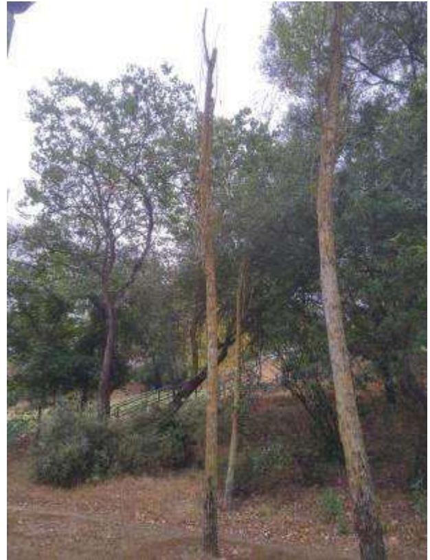
Fig. 6 - Aspeto geral do exemplar totalmente seco.