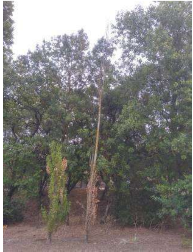
Fig. 2 - Aspeto geral do exemplar totalmente seco.