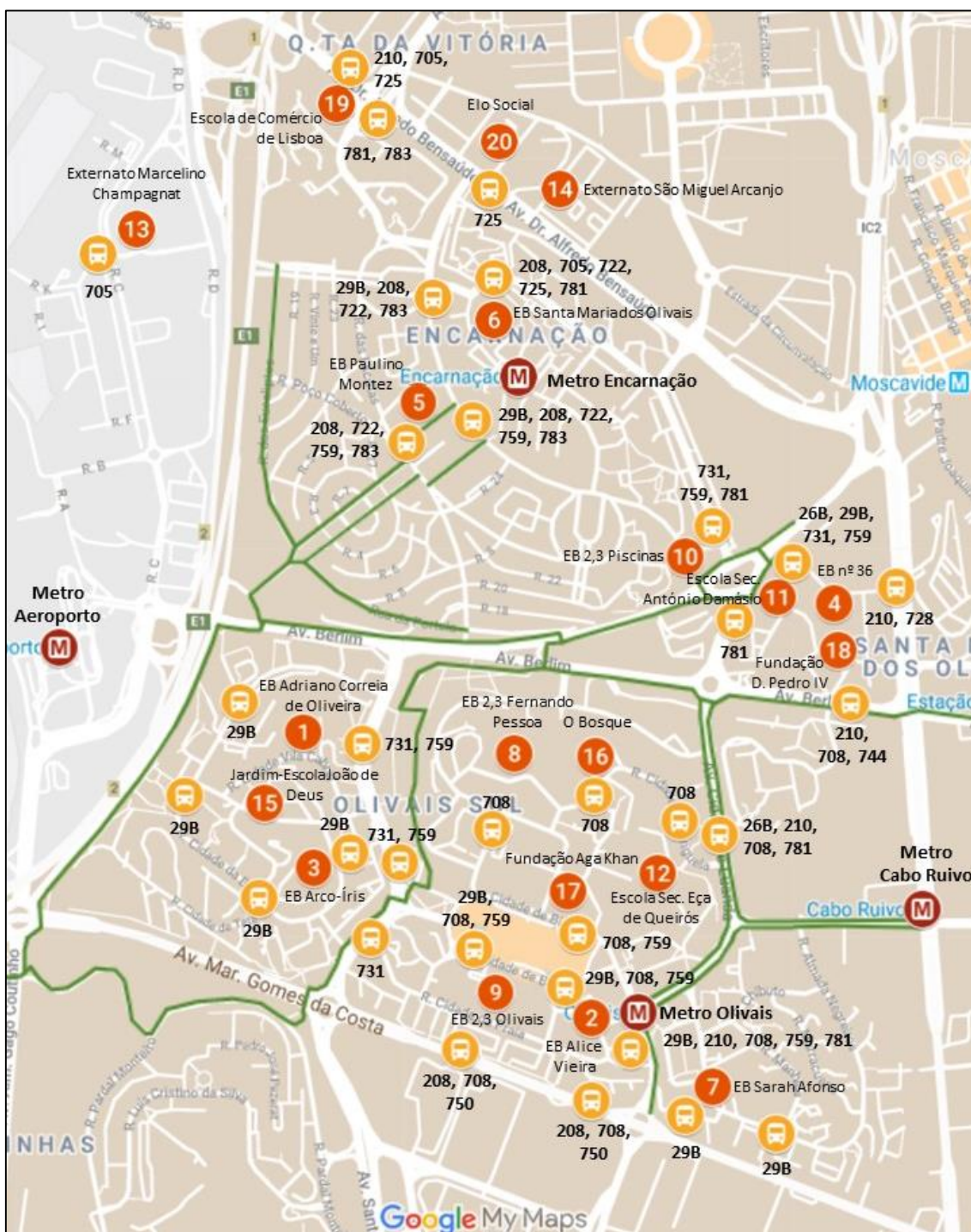
Figura 1 – Escolas, transportes públicos e ciclovias nos Oliva is

A figura seguinte localiza os estabelecimentos de ensino existentes na freguesia, assim como os transportes públicos e ciclovias próximos existentes.