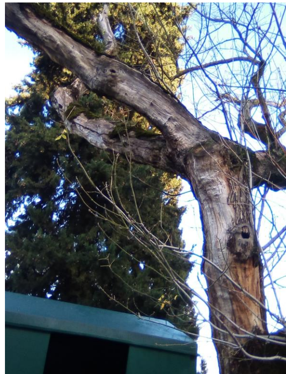
Foto 6 – Tronco e ramos apodrecidos no exemplar 330336462003