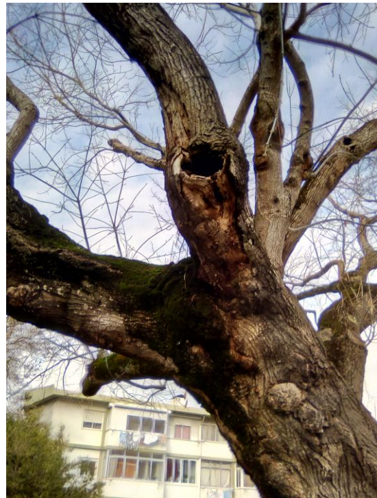
Foto 4 – Danos no tronco e ramos do exemplar 330336462002