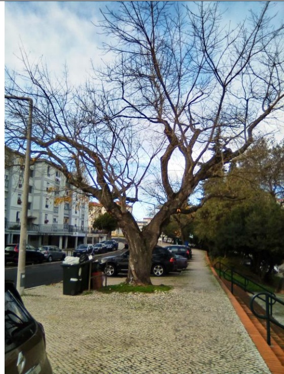
Foto 3 - Vista geral do exemplar 330336462002

Divisão de Manutenção e Requalificação da Estrutura Verde