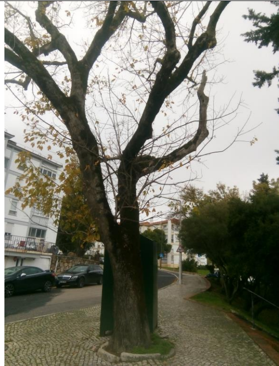
Foto 5 - Vista geral do exemplar 330336462003

Divisão de Manutenção e Requalificação da Estrutura Verde